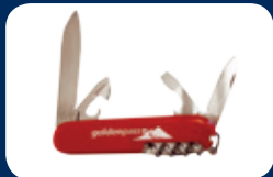
Couteau Victorinox CHF 22.–