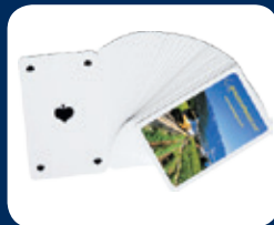
Jass / Poker CHF 5.–