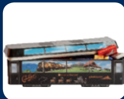
Locomotive Chocolat CHF 24.50