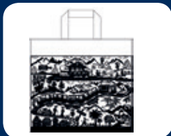
Sac cabas CHF 5.–