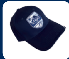
Casquette MOB CHF 19.–