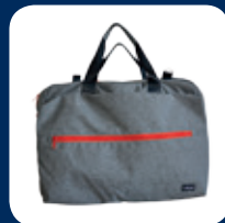
Brief bag CHF 98.–

According to stock available, thank you for your understanding!