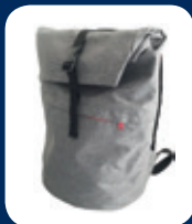
Urban bag CHF 75.–

Selon stock disponible, merci de votre compréhension!