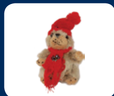
Peluche CHF 9.50/pce