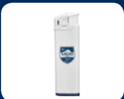
Briquet MOB / Led CHF 2.–