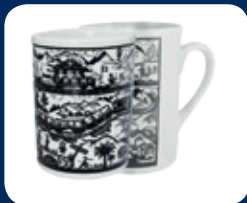
Tasse découpage CHF 7.–