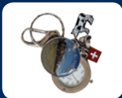
Porte-clés CHF 25.–