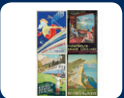
Set 5 cartes vintage CHF 5.–