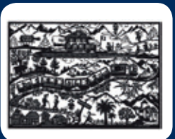
Carte postale CHF 1.50