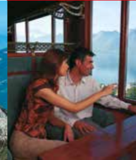
MOB Belle Epoque